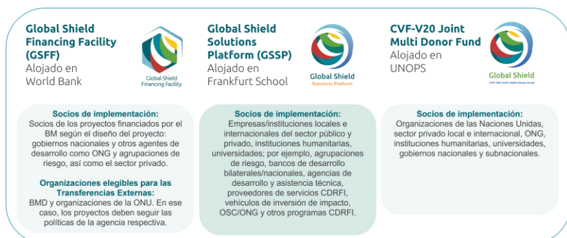
Figura 2: Estructura de Financiación de Global Shield

Global Shield Solutions Platform (GSPP), la Global Shield Financing Facility (GSFF) y el CFV-V20 Joint Multi-Donor Fund (JMDF) (véase la figura 2).