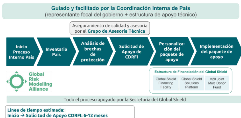
Figura 3: Proceso Interno del País del Global Shield

y apoyar al país en solicitar paquetes de apoyo a escala para cerrar las brechas de protección identificadas. En todo el proceso participan todos los actores interesados: instituciones gubernamentales, agentes humanitarios y de desarrollo, el sector privado, la sociedad civil y el mundo académico, así como representantes de los grupos vulnerables. El punto focal designado por el Ministerio coordinador encabeza el proceso como Coordinador de País y es responsable de convocar a las principales partes interesadas y de garantizar que los resultados se finalicen y aprueben.